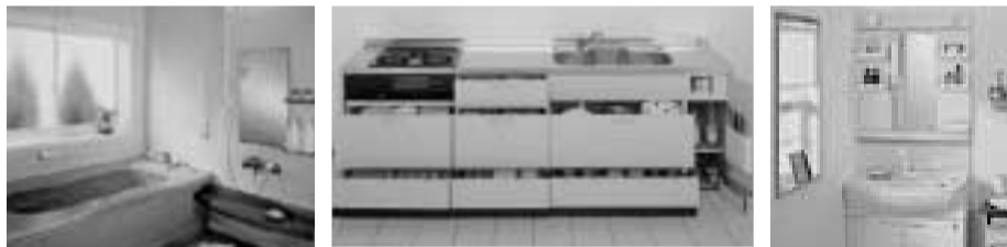
▲システムバスルーム ▲システムキッチン ▲シャワードレッサー