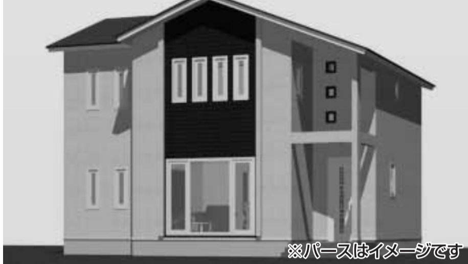
※パースはイメージです

価格には生活する為に必要な物はもちろん お客様のご要望のオプション工事も含んでいます。