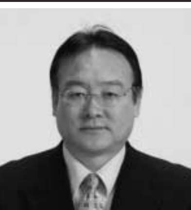
エービーシーホーム株式会社 代表取締役 3人の子供の子育て真最中、子育て世代の応援団、むつ市関根在住

「そろそろマイホームが欲しい」と思い行動し始めた多くの方がこんな状況に直面しています。「もう家なんていららない……」と疲れ果てあきらめてしまう方さえ